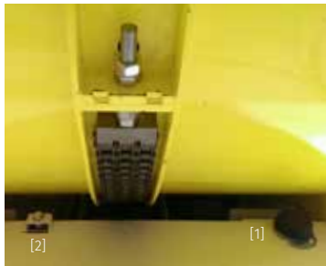
Fermi di fine corsa con tamponi [1] e sensori di prossimità [2]