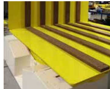
Opzionale: copertura superiore rigida in legno per EMS 30 -100