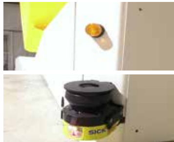
Scanner al laser e spie di avvertimento