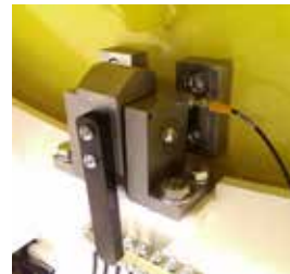
3 posizioni di bloccaggio (0 ° -45 ° -90 °) con monitoraggio