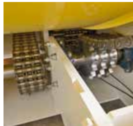
Trasmissione a catena tripla