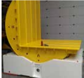
Estructura de acero sumamente robusta