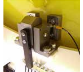
3 posiciones de bloqueo (0 ° -45 ° -90 °) con control