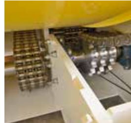
Accionamiento mediante triple cadena