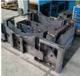
Módulos cortados con láser